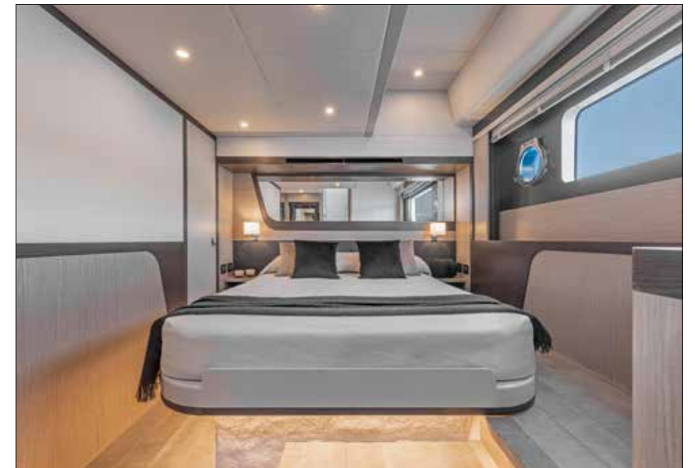
Plus large que la cabine twin, la VIP bénéficie d'un élégant habillage en chêne clair. La porte sur le côté gauche donne accès à un dressing fermé.

En cette fin d'été, la tramontane qui s'est levée sur la côte ligurienne complique un tant soit peu les manœuvres pour quitter le quai. C'est l'occasion de juger l'efficacité de l'option DockSense Control de Raymarine (lire l'encadré « Au fait... » page précédente). Dans une mer assez agitée, la position de conduite (siège baquet en cuir) et la visibilité sont de qualité. Unique ►