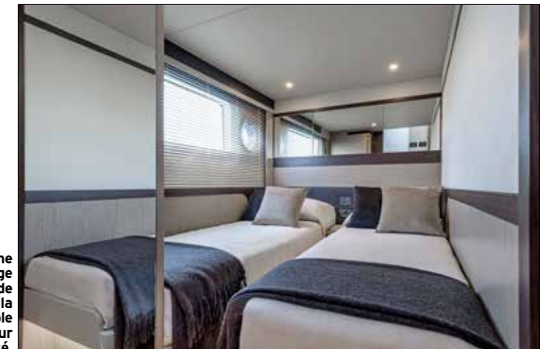
La cabine tribord partage sa salle de bains avec la cabine double située sur le flanc opposé.