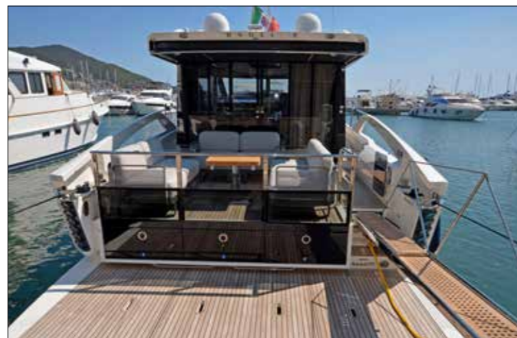
Une armature vitrée ferme le cockpit et renforce l'impression d'espace des passagers. La plateforme de bain est quasiment de plain-pied avec le salon.

superstructures, traitées en noir, viennent contraster plus franchement avec le blanc du gelcoat. L'ensemble donne au bateau une allure de coupé tendance et séduisant qui n'est pas sans évoquer