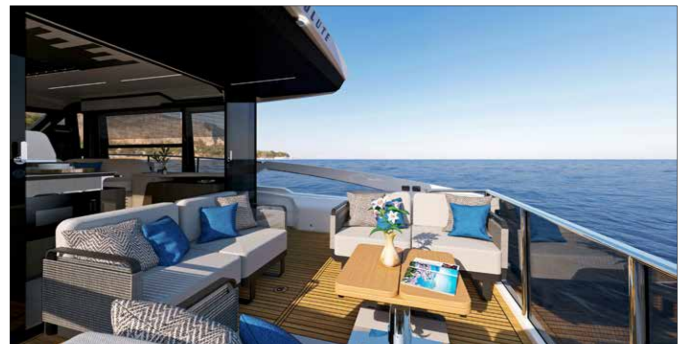
Dans le cockpit, les quatre fauteuils amovibles sur patins antidérapants se positionnent comme on le souhaite. Une vraie trouvaille!