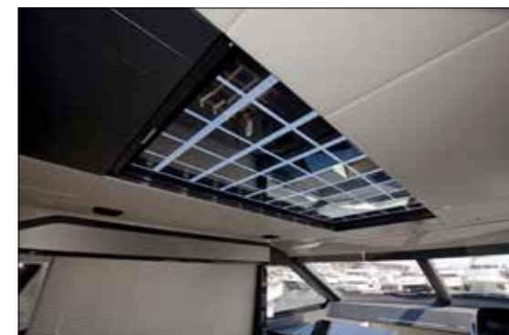
Le plafond laisse voir une partie du panneau de verre intégrant les cellules photovoltaïques aussi utiles qu'esthétiques.

l'univers de l'automobile de prestige. Sous la timonerie, la présence de panneaux solaires intégrés à la structure en remplacement du toit ouvrant constitue une petite révolution. Les cellules représentent au