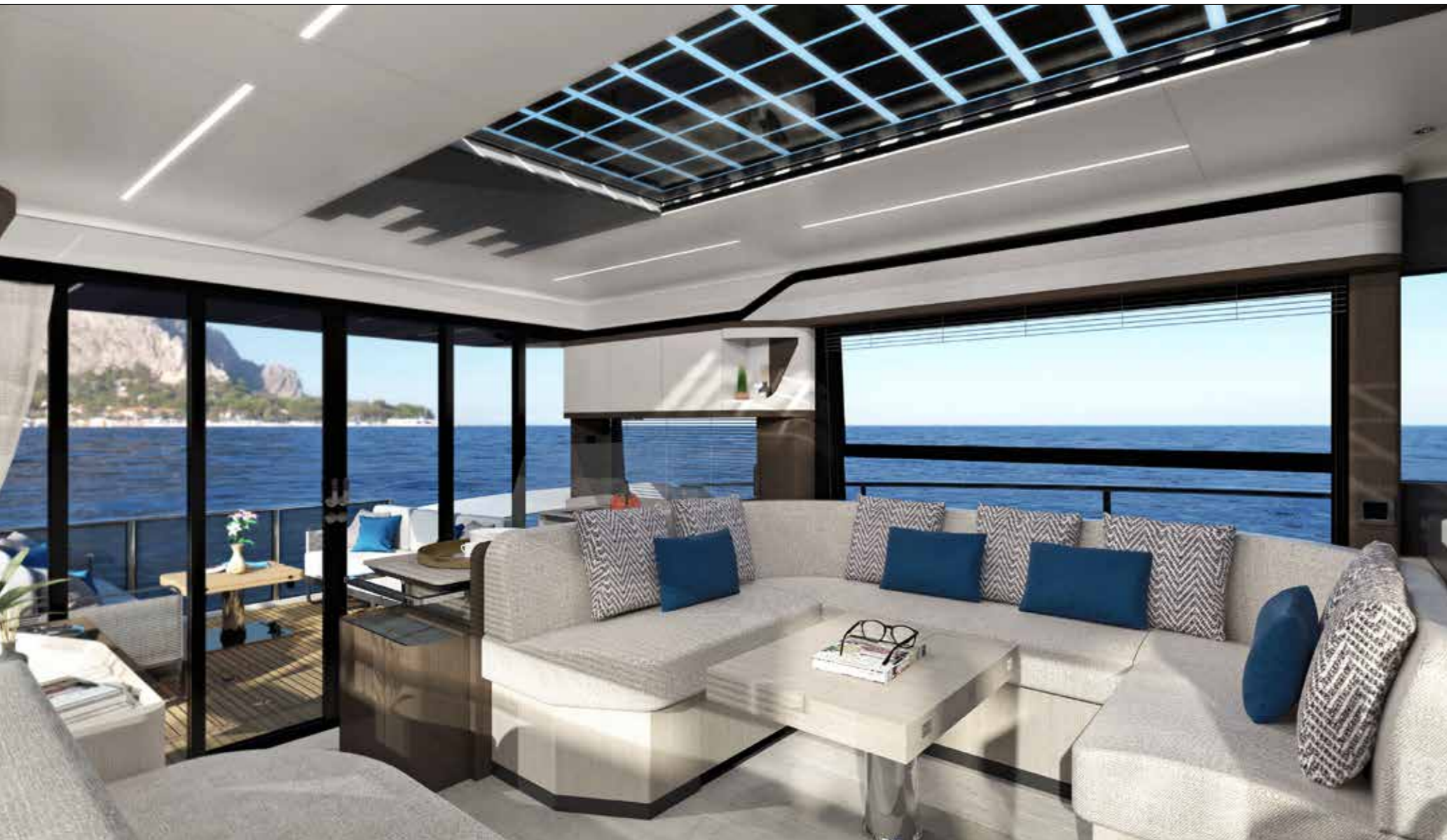
La baie vitrée à quatre vantaux coulissants occupe toute la largeur de la timonerie. Un effet transparence qui change la perspective.

► l'usage de la climatisation. Le système est d'autant plus indispensable qu'il n'y a pas de toit ouvrant. Absolute avait pris soin de baptiser ce premier modèle « Horizon ». Le nom colle assurément bien avec l'esprit du pont principal, qui cherche à renforcer la fluidité des déplacements entre le cockpit et la timonerie. La baie vitrée arrière, constituée de quatre pans mobiles, s'escamote complètement, formant avec le cockpit tout en longueur un espace ouvert dont la perspective est accentuée par l'absence de tableau arrière, remplacé par une structure vitrée. Six fauteuils individuels avec dossiers et accoudoirs amovibles reposent sur des patins antidérapants. Il est ainsi possible en les changeant de place de multiplier les atmosphères à l'infini: carré classique avec table de repas, grand bain de soleil ou cockpit entièrement