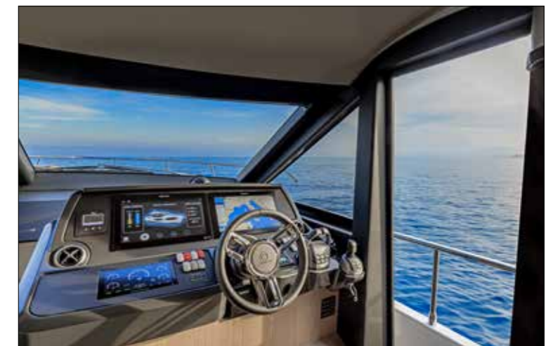
Le poste de pilotage est à proximité d'une porte coulissante très utile pour accéder rapidement au passavant tribord et surveiller la manœuvre.

mieux une puissance de 2,5 kW, ce qui n'a rien de ridicule. Cette énergie d'appoint permet de répondre de façon totalement autonome aux besoins en mouillage forain: réfrigérateur, écran LCD, sono, éclairage, pompes de cale et alarmes. Le système d'air conditionné, la plateforme et le gril électrique nécessitent toujours le soutien d'un groupe électrogène de 17 kW. Les panneaux solaires