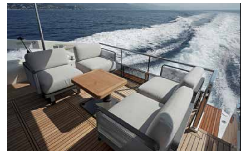
Absolute reprend l'idée d'un mobilier modulaire, que l'on peut déplacer ou retirer au gré des situations.

salon séparé de l'espace navigation. Le poste de pilotage ergonomique est équipé d'un saute-vent en plexi réglable en hauteur, qui a déjà prouvé son efficacité. Le pont principal recueille quant à lui les changements les plus radicaux. La marque italienne reprend ainsi l'idée du cockpit modulable, développée la première fois à bord de l'Absolute 48 Coupé (Neptune n°302, novembre 2021). Elle en a fait sa marque de fabrique. La sur-