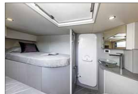
Spacieuse et aménagée avec soin, la cabine de marin communique avec la salle des machines.

Dans le même esprit, les passavants symétriques sont désormais balisés par un léger surbau de coque et un balcon avec filière en câble façon voilier, ce qui ouvre un peu plus le panorama extérieur depuis l'habitacle. Enfin, la plage avant se distingue par son canevas