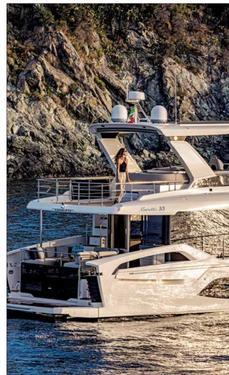
La poupe est dynamisée par un franc-bord ajouré en forme d'accent. Notez la longueur de la casquette de fly, qui couvre tout le cockpit.