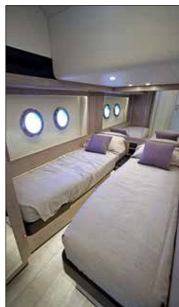
La cabine latérale est munie de deux lits simples avec matelas à mémoire de forme. Le miroir en tête de lit agrandit l'espace.

La cabine avant avec lit à 45° par rapport à l'axe de la coque est la marque de fabrique d'Absolute. Les hublots panoramiques à l'avant aussi.