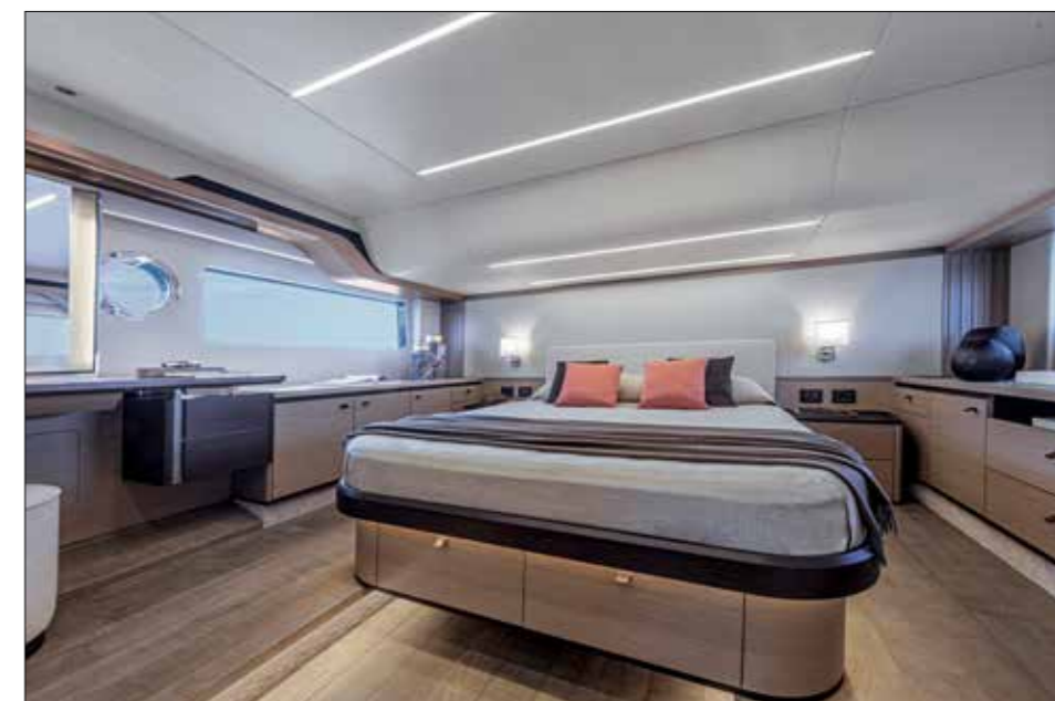
La master-cabin pleine largeur est flanquée de deux consoles de rangements et d'un coin bureau. La hauteur sous barrots est supérieure à 2 m, sauf au niveau de la tête de lit.