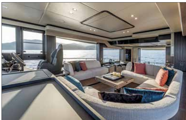
Le salon aux formes arrondies bénéficie des grands vitrages pleine hauteur, qui offrent une vue dégagée sur la mer.

Les vitrages panoramiques impressionnent par leur ampleur. Le plancher gris à larges lattes, avec « effet scié » comme le mentionne la nomenclature, est des plus originaux.