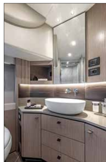
Meuble en chêne clair, vasque, plateau en Corian et robinetterie murale: la salle de bain est luxueuse.